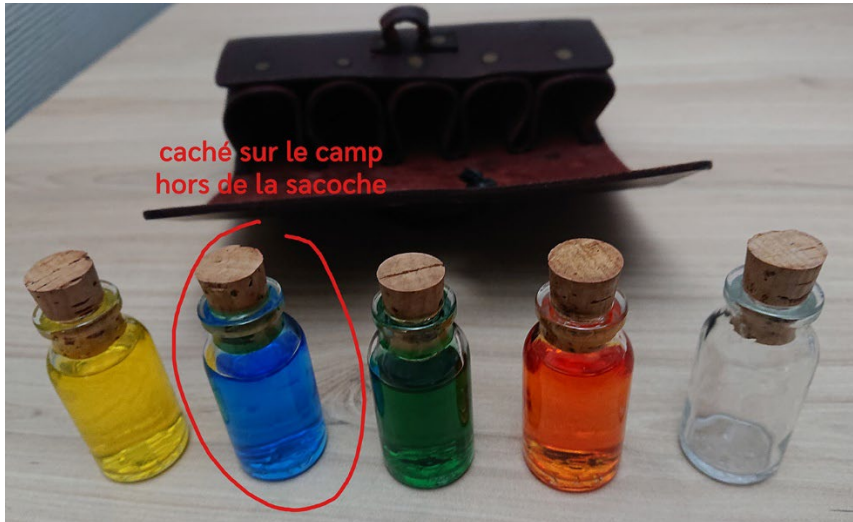
Doc. 3 : Sacoche de fioles jaune-bleu-vert-orange

Une sacoche de fioles de couleurs indique la bonne combinaison de couleurs (Doc. 3). Trois fioles sont dans la sacoche, la dernière cachée sur le camp.