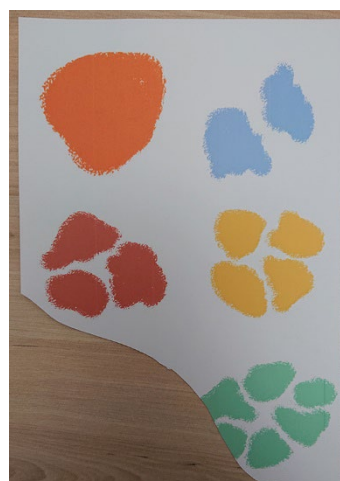
Doc. 2 : Document sur le camp